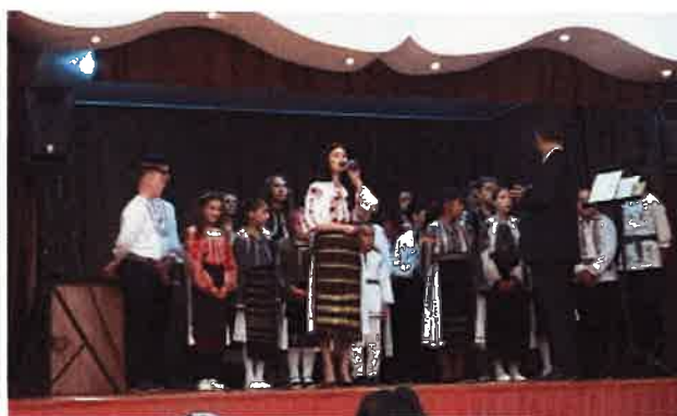
„ Pridvorul Tinereții Crețeni 2017”

Marți 18 Aprilie a avut loc la Parohia Sf. Parascheva , din orașul Rm. Vâlcea, un concert de pricesne și poezie religioasă, din cadrul proiectului „ Lăsați copiii să vină la mine ”, cu participarea aceluiași cor.